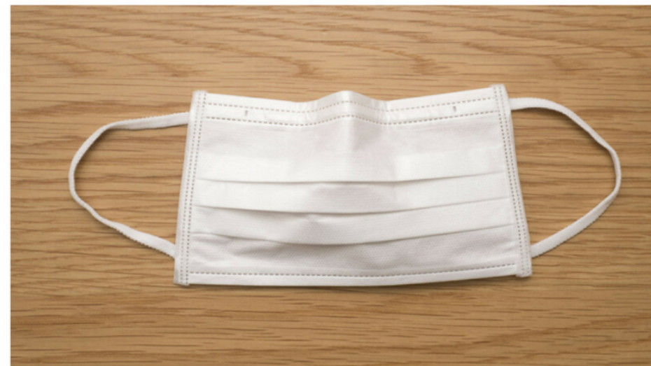
マスクの扱い方

緊急事態宣言が解除され、「新しい生活様式」による暮らしが始まってから約1カ月が経過しました。「感染防止の3つの基本」のひとつとして、日常生活でも「マスク着用の習慣」はすっかり定着しましたが、食事の際や汗をかいたときなど、外したマスクの取り扱いに困ってしまう場面も増えましたよね。